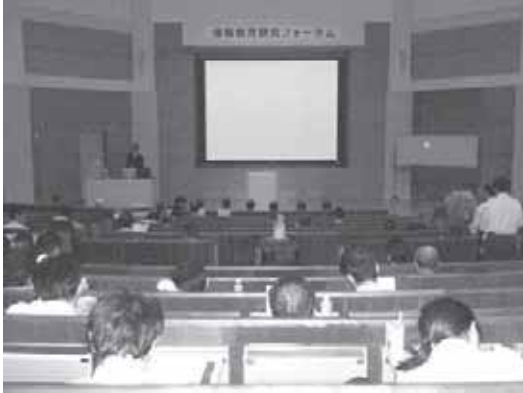
写真1 第1回フォーラムの様子