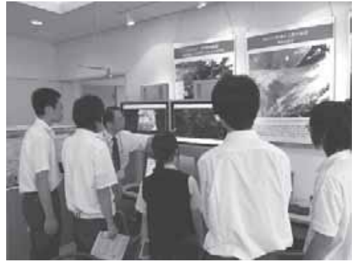
写真3 大学研究室見学の様子