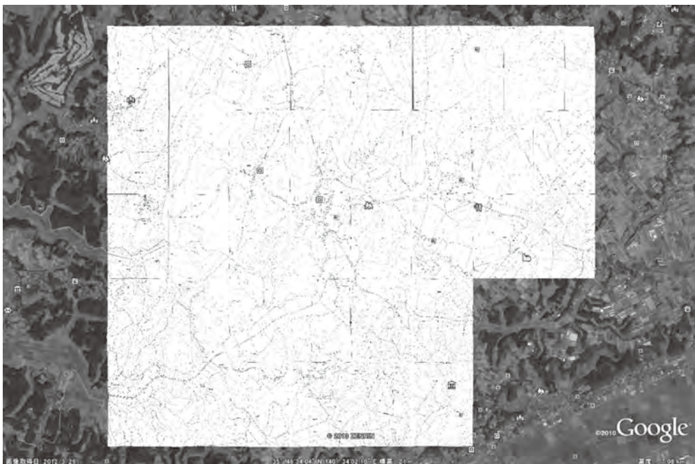
図表 1 KML ファイルを用いて住居地図を重ね合わせた状態