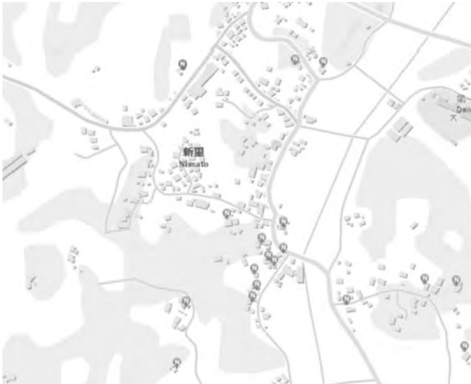
図表5 印刷版の井戸地図の一部分を拡大したもの (ArcGISを用いて許可を得て住民に配布している)

図表5は図表2で示したアンケート結果を井戸地図としたものであり、井戸の場所や使用形態が示されている。この印刷版作成にあたっては2つの課題が存在した。一つ目は作成上の著作権の問題である。ウェブを中心とする利用においては、「印刷物への掲載を控えてもらいたい」との要望も存在する。今回の井戸地図では背景となる地図をウェブ版と印刷版で変えるなどの方法を試みている。二つ目は個人情報保護の問題である。住所は重要な個人情報であり、流出することは好ましくない。今回の井