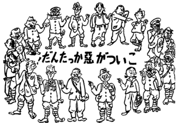
図4 麻生豊 1946/01/15 『新漫画』