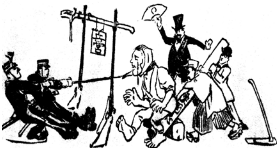
図2 「強制された愛国心」 1904/01/17 『平民新聞』