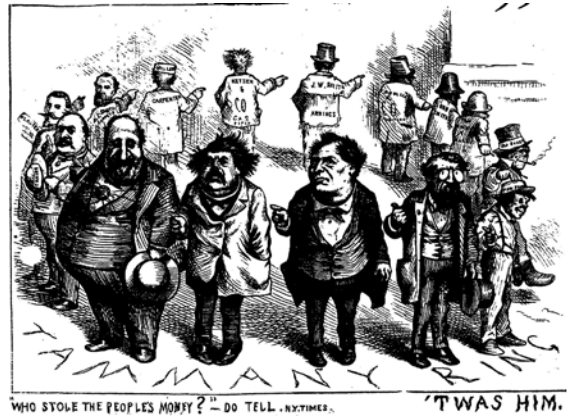
図3 Thomas Nast 1871/08/19 Harpers Weekly